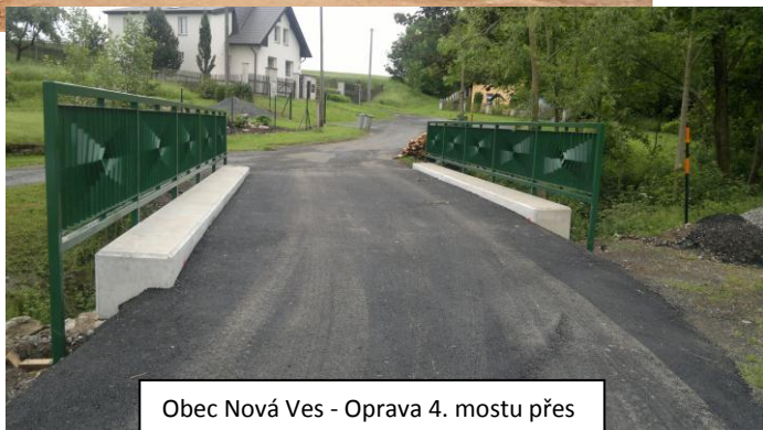
Obec Nová Ves - Oprava 4. mostu přes Novoveský potok