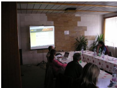
Obec Maleč: Rozvoj obcí a NNO