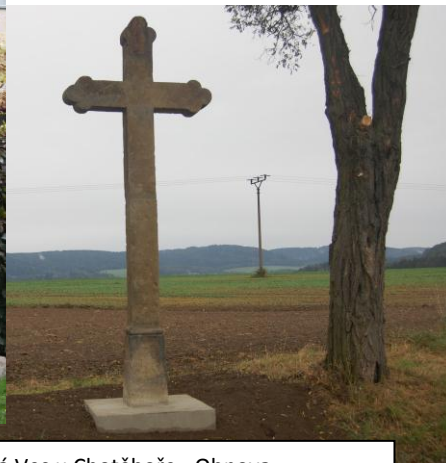
Obec Nová Ves u Chotěboře - Obnova pamětních míst a drobných sakrálních staveb