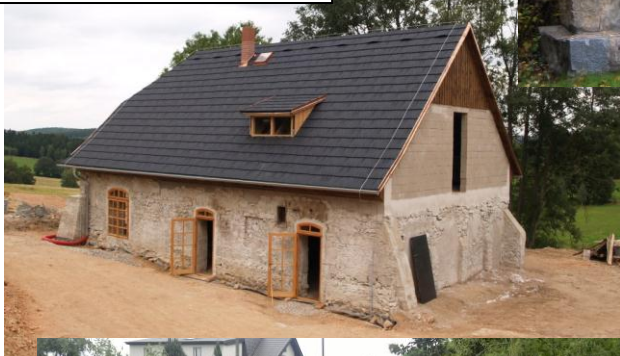
o.s. Benediktus - Záchrana objektu bývalých lázní na Modletíně-1.fáze